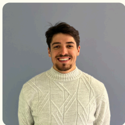
Baptiste Pôle Projets