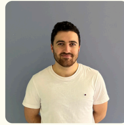
Sacha Pôle Partenariats