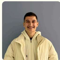
Mathis Pôle Projets