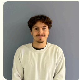
Arthur Pôle Communication