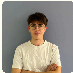
Romain Pôle Kermesse