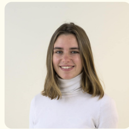
Karen Pôle Communication