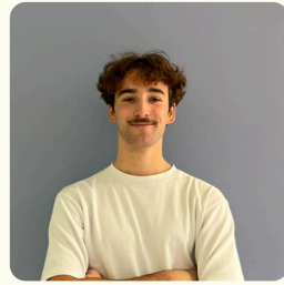
Julien Pôle Partenariats